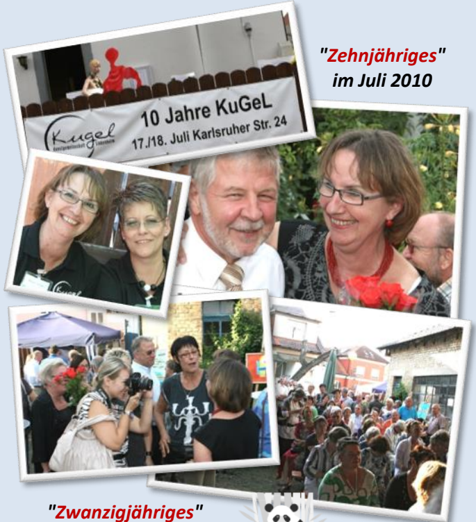
"Zehnjähriges" im Juli 2010