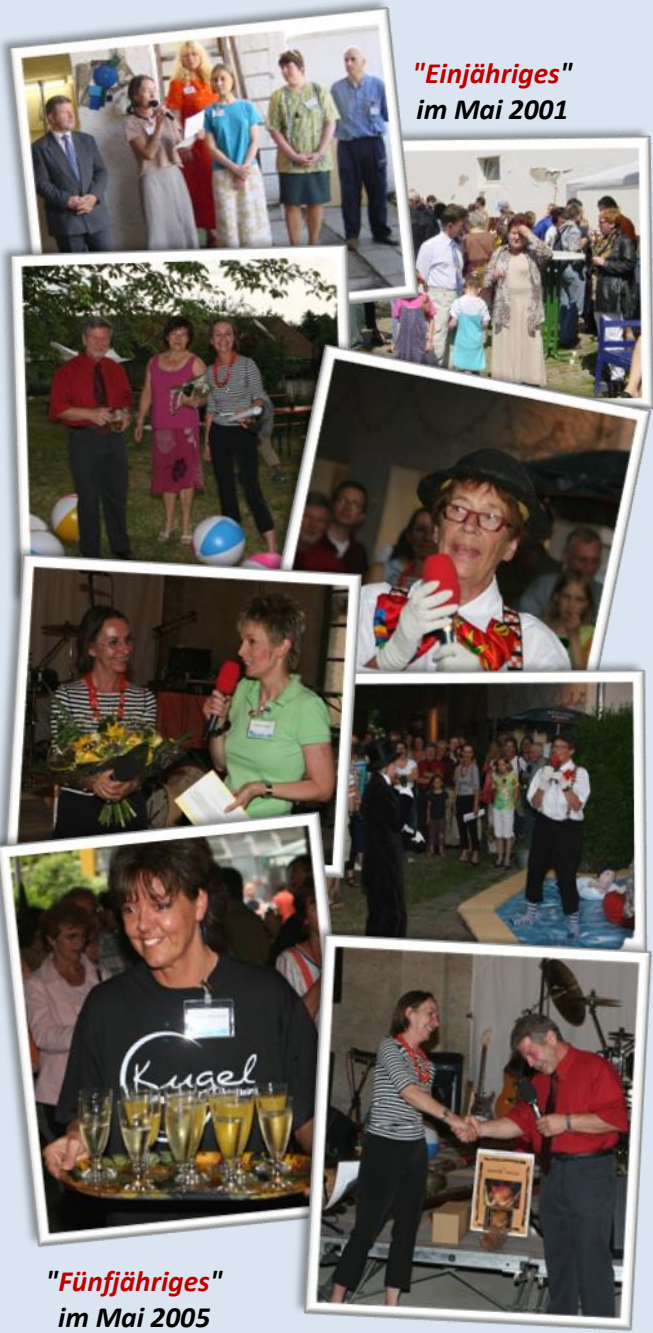
"Einjähriges" im Mai 2001